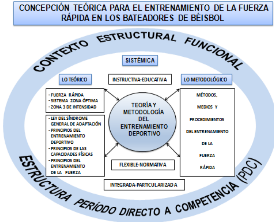
Figura 1. Concepción teórica para el entrenamiento de la fuerza rápida en los bateadores de Béisbol.

Metodología propuesta para el entrenamiento de la fuerza rápida en los bateadores de Béisbol.