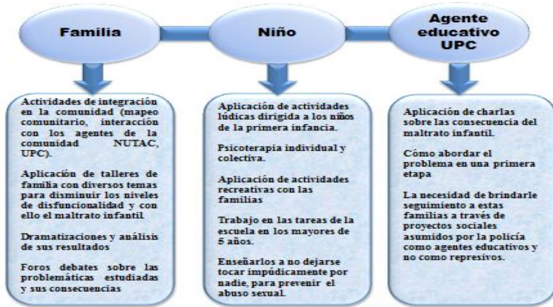
Figura 1. Acciones realizadas por los estudiantes de la carrera de psicología como parte de la estrategia de intervención antes mencionada.

Las actividades de la propuesta estuvieron direccionadas a disminuir el maltrato infantil. A continuación se exponen evidencias del trabajo realizado (Figura 2 y Figura 3).