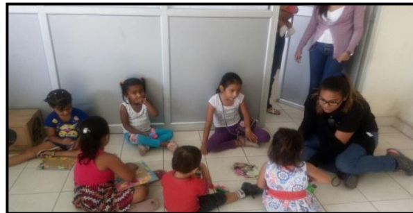
Figura 3: evidencias de actividades

Al culminar este trabajo se pudo observar los siguientes resultados: mejoramiento de apariencia y cuidado de los menores estudiados por parte de su familias en un 80,8%, disminución de la negligencia y los niveles de violencia en un 88,5%, mayor sensibilización de los padres u otros