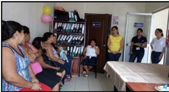
Figura 2: evidencias de actividades

Las actividades de la propuesta estuvieron direccionadas a disminuir el maltrato infantil. A continuación se exponen evidencias del trabajo realizado (Figura 2 y Figura 3).