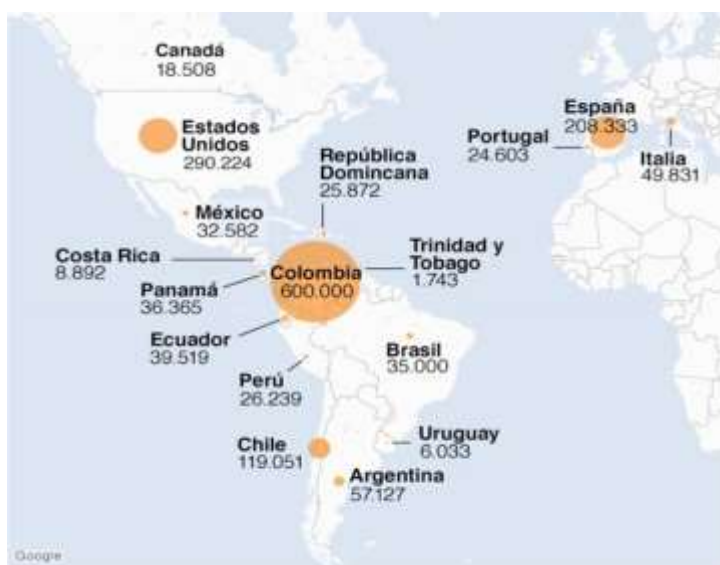
Figura 3. Proceso migratorio de ciudadanos venezolanos.