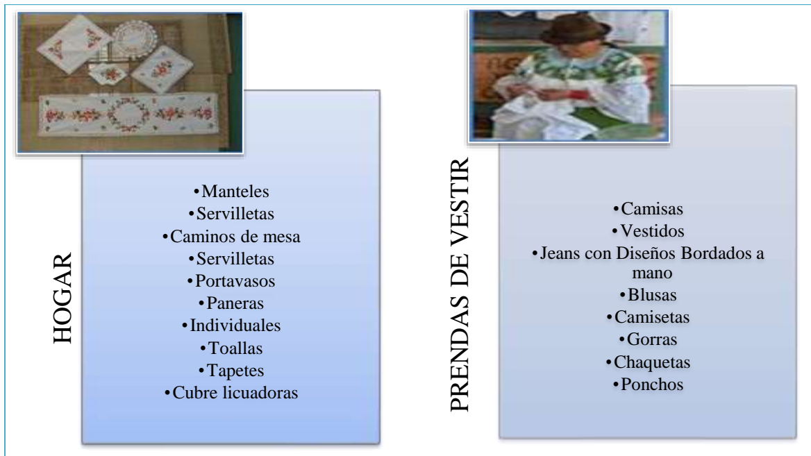
Figura 1: Tipología de productos artesanales.

Las socias integrantes de la Asociación de mujeres bordadoras de Zuleta, ofertan una variada gama de productos para todo tipo de clientes; los bordados se caracterizan por su elaboración a mano con técnicas de acabado muy finas, en diversos diseños y colores, poniendo de manifiesto las expresiones y características culturales e identitarias de la comunidad, así como también plasmando en sus trabajos la manera de ver al mundo a través de la cosmovisión andina.