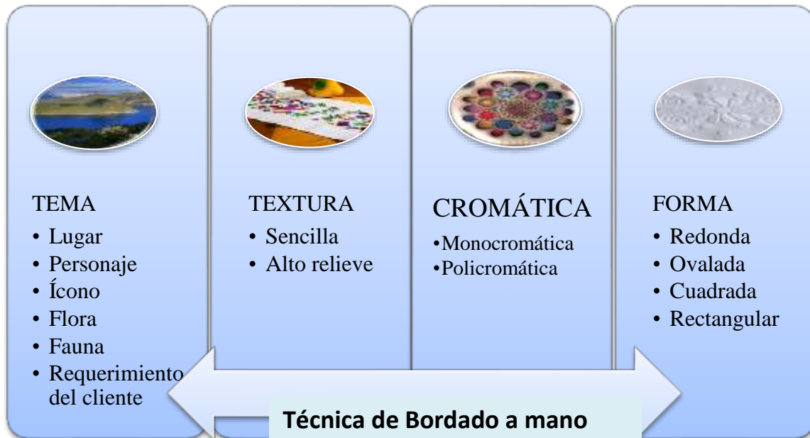
Figura 2: Tipología de los Motivos aplicados en los productos artesanales bordados a mano.

A continuación, se presenta los motivos aplicados en los bordados en diferentes tipos de tela.