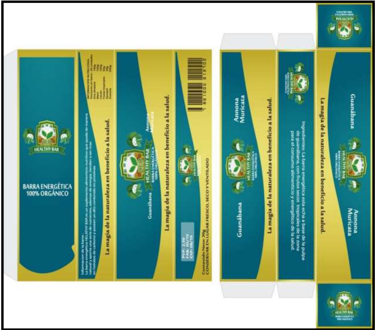
Figura 6. Diseño de la caja.

Amarillo: Simboliza el sol y el clima tropical de la zona.