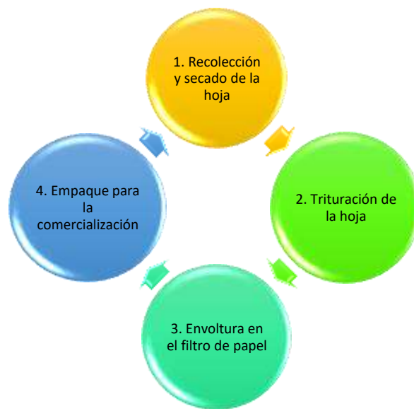
Figura 4. Elaboración de la guanábana.