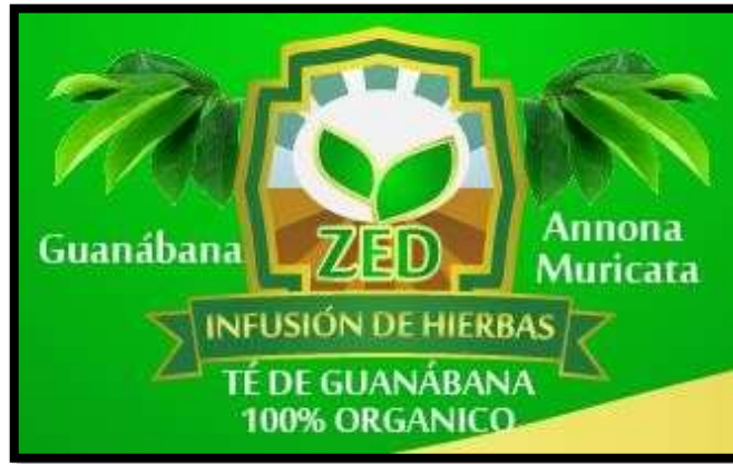
Figura 1. Logotipo.

del proyecto. La idea del logotipo es dar a conocer de donde proviene el producto además destaca cada color que brinda la naturaleza y sus fuertes cultivos de donde proviene la guanábana.