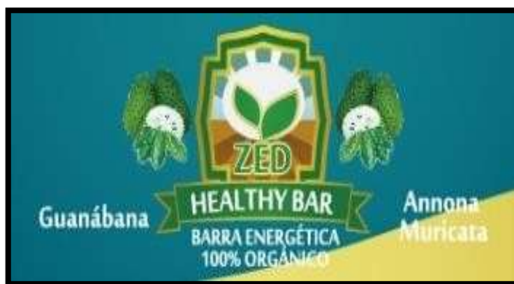
Figura 5. Logotipo.

Logotipo: El logotipo está basado en nombre de la empresa “ZED” (integrantes del proyecto) brindando un producto de calidad y buen sabor como es la barra energética a base de la guanábana, con el nombre de “HEALTHY BAR” siendo una barrasaludable.