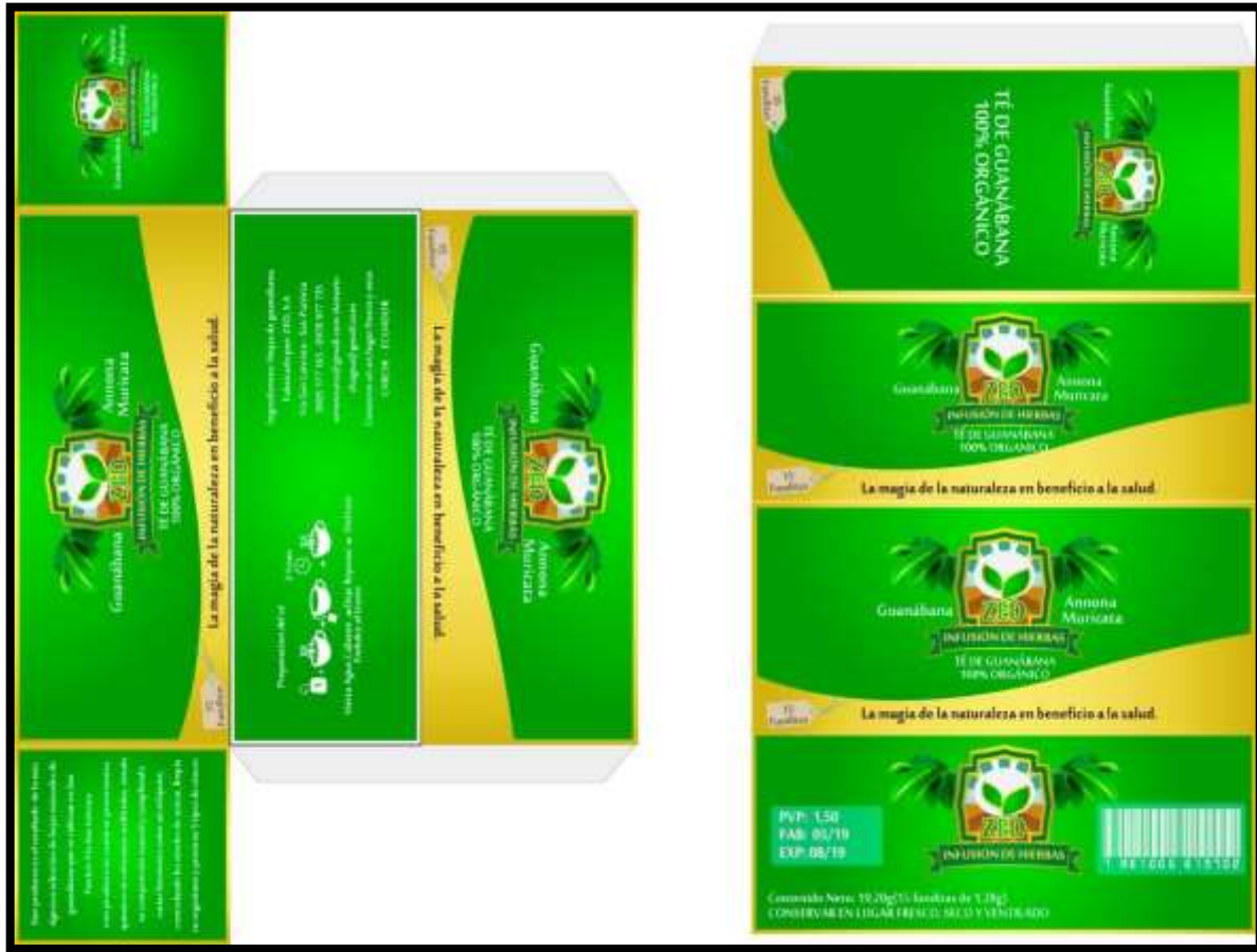
Figura 3. Diseño del empaque.