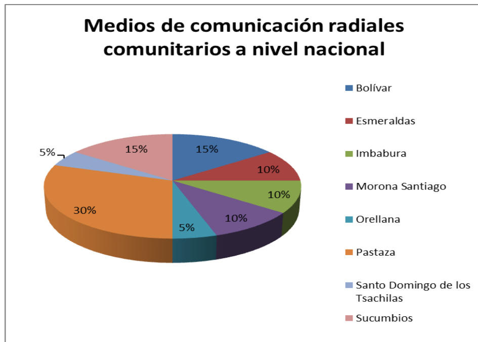
Gráfico 2. Medios de comunicación radiales comunitarios a nivel nacional.