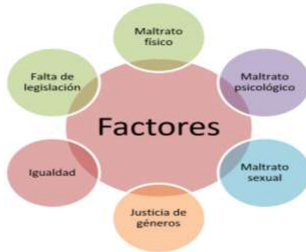
Figura 1. Factores que dan origen al feminismo radical.

Se listan posteriormente, el total de causas y sub-causas (18 en total) para someterlas a una clasificación y un orden en cuanto a maltrato físico, maltrato psicológico, maltrato sexual, justicia de género, igualdad y desamparo legal. Del análisis de las frecuencias de las causas se determinará que factor se debe potenciar de forma primaria y secundaria (Ver tabla 1).