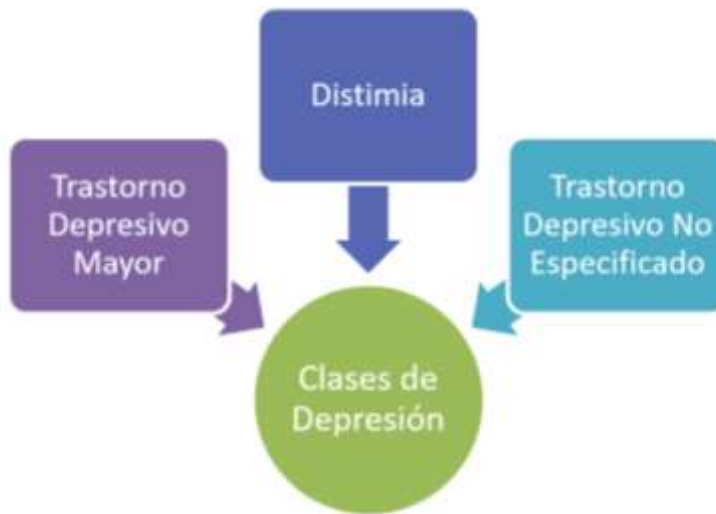
Figura 3. Clases de Depresión. Elaboración propia.