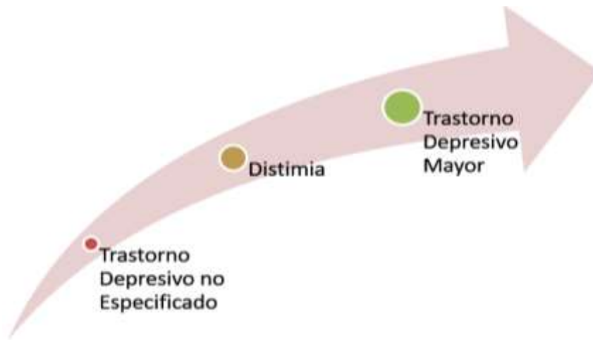
Figura 5. Etapas y agravantes de las clases de depresión. Elaboración propia.

De los resultados obtenidos de los expertos, se obtuvo un consenso mayor del C \geq 75\% . De las etapas y agravantes que se visualizan, los expertos argumentaron el choque desde el nivel inferior hasta el mayor impacto en el desarrollo de los niños, niñas y adolescentes.