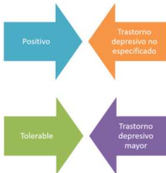
Figura 6. Puntos de choque entre tipos de estrés y clases de depresión.