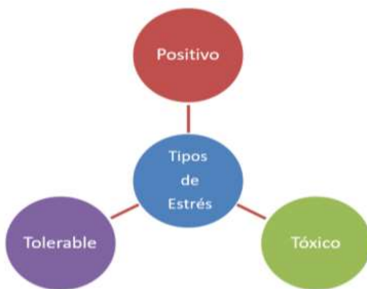
Figura 2. Tipos de estrés. Elaboración propia.