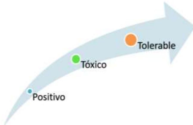
Figura 4. Etapas y agravantes de los tipos de estrés. Elaboración propia.