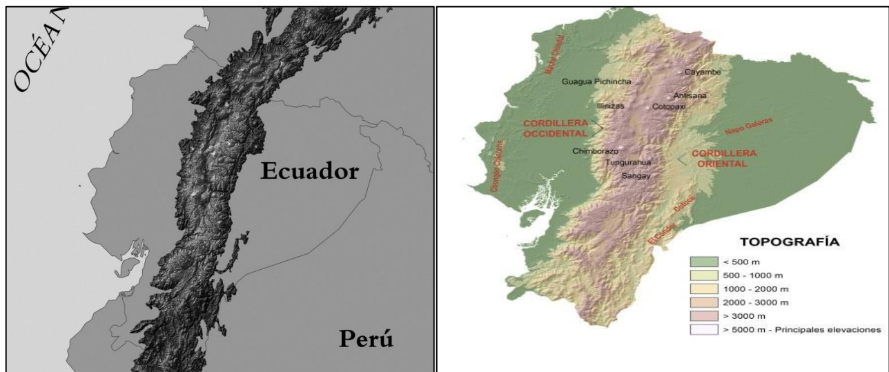
Figura 1. Diferentes vistas de la topografía andina ecuatoriana y sus principales puntos de interés.

La figura 1 muestra la extensión del corredor andino en el Ecuador y las elevaciones y estructuras volcánicas que matizan dicho paisaje.