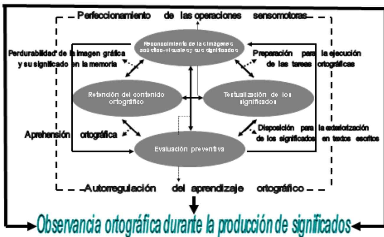
Figura 1. Modelo didáctico de prevención ortográfica.

En su condición de rector, el primer componente prevé que el proceso concluya con la habilidad lingüística más compleja que es la producción textual, la que exige del uso de las destrezas ortográficas, léxicas, morfológicas y sintácticas. Al realizar la representación final de los significados seleccionados, se actualizan las tareas del pensamiento en las ejecuciones de mayor exigencia con retroalimentación.