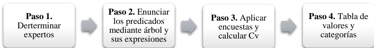
Figura 2. Pasos para aplicar la LDC.