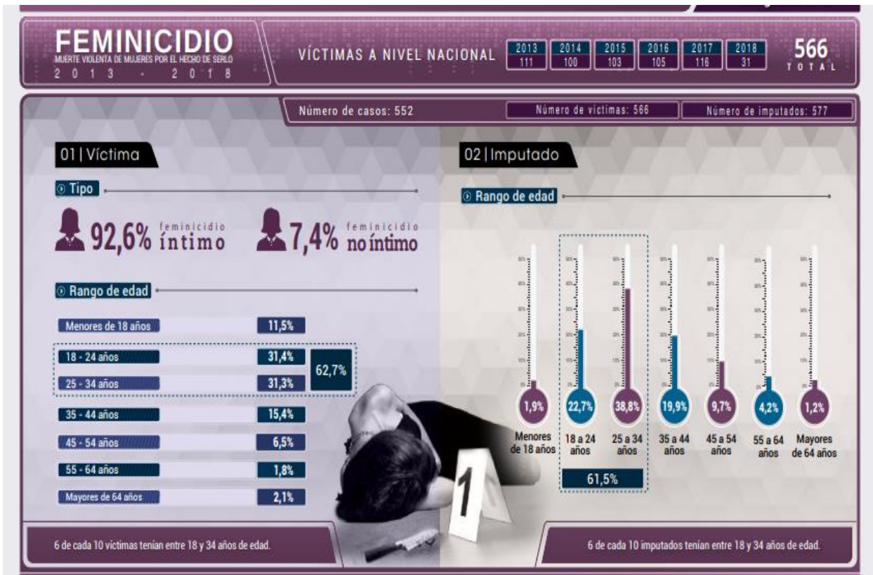
Figura 2. Víctimas de feminicidio a nivel nacional. Tomado del Observatorio de Criminalidad. Según El Ministerio Público, Fiscalía de la Nación (2020), https://www.mpf.n.gob.pe/observatorio/