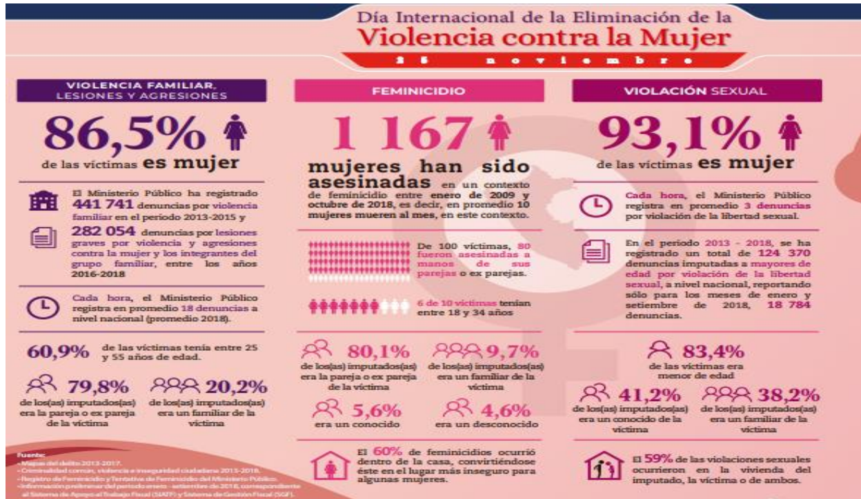
Figura 1. Estadísticas por el Día Internacional de la Eliminación de la Violencia contra la Mujer (2018). Tomado del Observatorio de Criminalidad. Según El Ministerio Público, Fiscalía de la Nación (2020) https://www.mpf.n.gob.pe/observatorio/