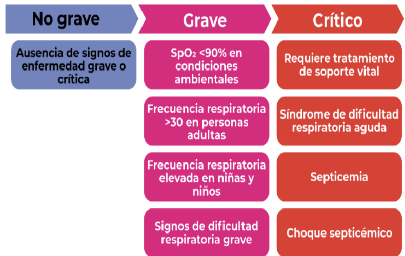
Figura 2. Manejo clínico de la COVID-19: orientaciones evolutivas, 2021.

Dicho lo anterior, hasta el momento se ha hablado de las características y desarrollo de la enfermedad de pacientes contagiados por COVID-19, que aunque es de suma importancia la transmisión de información actualizada, también es necesario identificar las características de los pacientes que han sido dados de alta intrahospitalaria y que deben continuar con su convalecencia respecto a las secuelas de la enfermedad en la casa, y que comúnmente son atendidos por algún familiar.