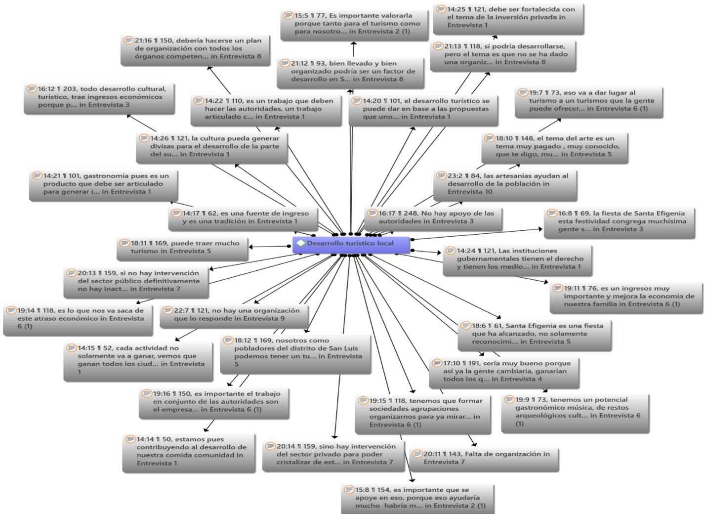
Figura 3. Red de citas de la categoría: desarrollo turístico local.

Nota: Red de citas obtenida a través del procesador Atlas. ti para la categoría desarrollo turístico local generado a partir de la entrevista a pobladores.