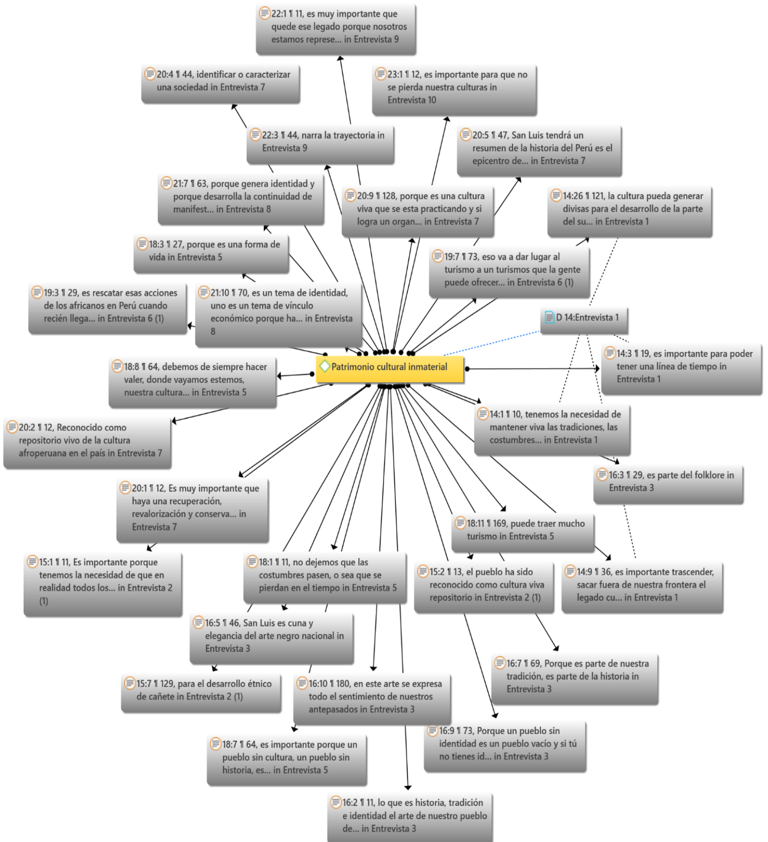
Figura 2. Red de citas de la categoría: patrimonio cultural inmaterial.

Nota: Red de citas obtenida a través del procesador de Atlas. ti para la categoría patrimonio cultural inmaterial generado a partir de la entrevista a pobladores.