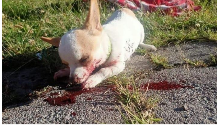
Imagen 3. Mascota agredida brutalmente. Fuente: El Universo. Elaborado por: Testigos presenciales.

Esta mascota fue pateada cruelmente por una turba de personas que pasaron protestando en el sur de Quito. No sabemos quién pueda ser, pero ladraba en la calle a las personas que gritaban durante la protesta, un par de personas simplemente la patearon en varias ocasiones. La dejaron convulsionando en el piso. Claramente, ella no entiende de manifestaciones (El Universo, 2022).