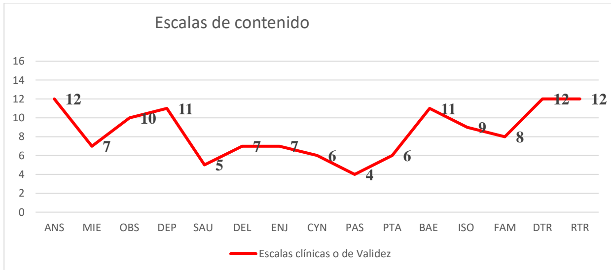
Tabla 5. Escalas de contenido.

De acuerdo con los resultados arrojados, es evidente que dichos estudiantes que contestaron esta prueba presentan en un número significativo conflictos en su personalidad como son: ansiedad, obsesividad, depresión, bajo autoestima, problemas familiares, entre otros, además que de acuerdo con el ítem RTR, existe la posibilidad de recibir apoyo u orientación en estos factores de mencionada personalidad, siendo evidente que vulneran el rendimiento académico y otras áreas de vida.