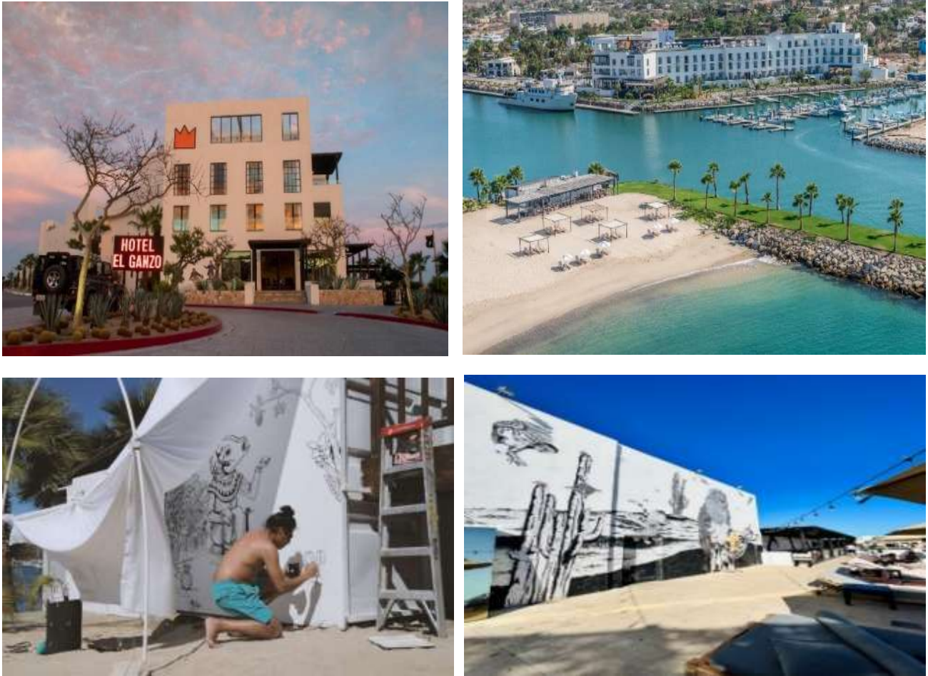
Figura 3. Hotel el Ganzo.