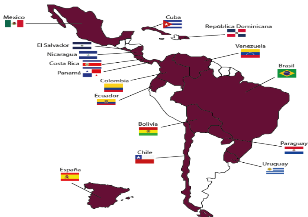
Figura 1. Países de Latinoamérica pertenecientes a RIACES.