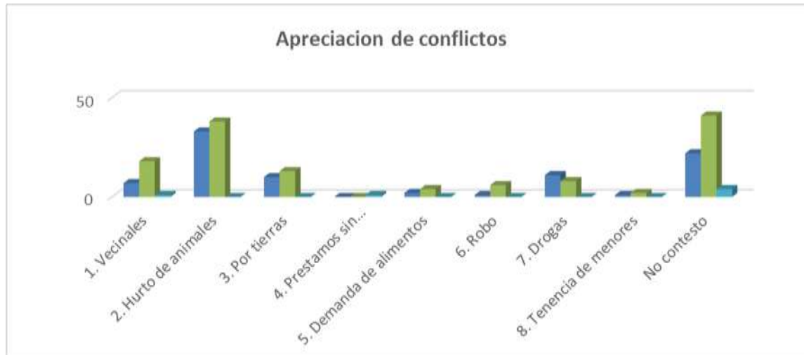
Tabla de apreciación de conflictos.

Como se aprecia en la tabla, es significativo el hurto de animales, los conflictos de convivencias y los conflictos por tierra, resulta evidente como aprecian el incremento de otros problemas sociales como las drogas, siendo la manifestación del silencio un índice muy alto de expresión.