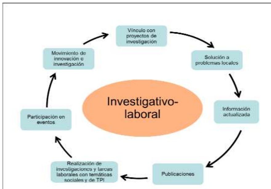
Gráfico 2. Características de las tareas a planificar en el componente investigativo-laboral.

Para la salida del componente investigativo-laboral, como se muestra en el gráfico 2, las tareas deben caracterizarse por: lograr el vínculo con proyectos de investigación, la contribución a la solución de problemas locales, la búsqueda de información actualizada, promover la realización de publicaciones, propiciar la realización de investigaciones y tareas laborales con temáticas sociales y de TPI, favorecer la participación en eventos y la incorporación al movimiento de innovación e investigación.