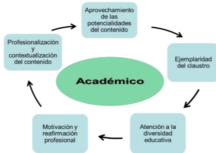
Gráfico 1. Características de las tareas a planificar en el componente académico.

Para la salida del componente investigativo-laboral, como se muestra en el gráfico 2, las tareas deben caracterizarse por: lograr el vínculo con proyectos de investigación, la contribución a la solución de problemas locales, la búsqueda de información actualizada, promover la realización de publicaciones, propiciar la realización de investigaciones y tareas laborales con temáticas sociales y de TPI, favorecer la participación en eventos y la incorporación al movimiento de innovación e investigación.